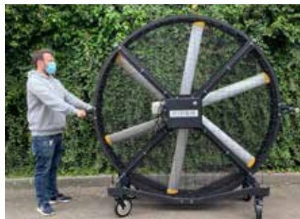
Ventilatorhöhe 2,05 m

UVP: 4.499,- 2.395,- zzgl. MwSt. & Fracht